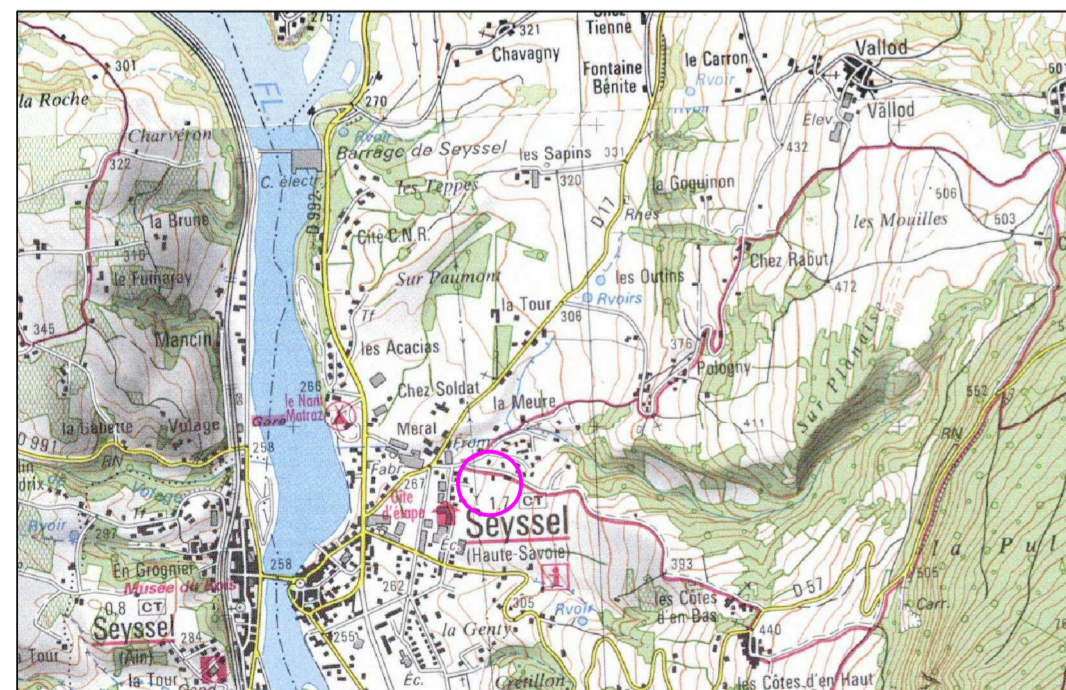
Plan de situation (échelle : 1/25000)

N° DOSSIER : 13.03.61 Levé terrain : 02/04/2013 Bornage : 30/07/2013 dessiné par A.Z.